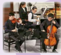
大江馨 [ヴァイオリン] 岡本侑也 [チェロ] 反田恭平 [ピアノ]