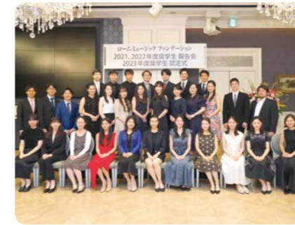
認定式・報告会(2023年)

奨学生に採択された方は、スカラシップ コンサートのほか、認定式・報告会、懇親会、アーティスト研修会などさまざまな行事にご参加いただくことができます。