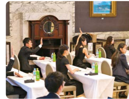
アーティスト研修会(2023年)