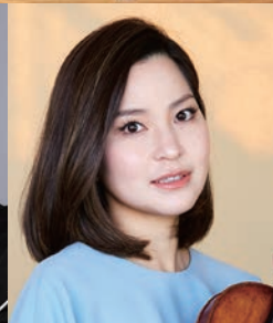
神尾 真由子(ヴァイオリン)