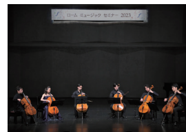
受講生と講師によるアンサンブル