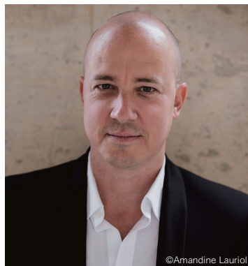
ジュリアン・ジェルネ