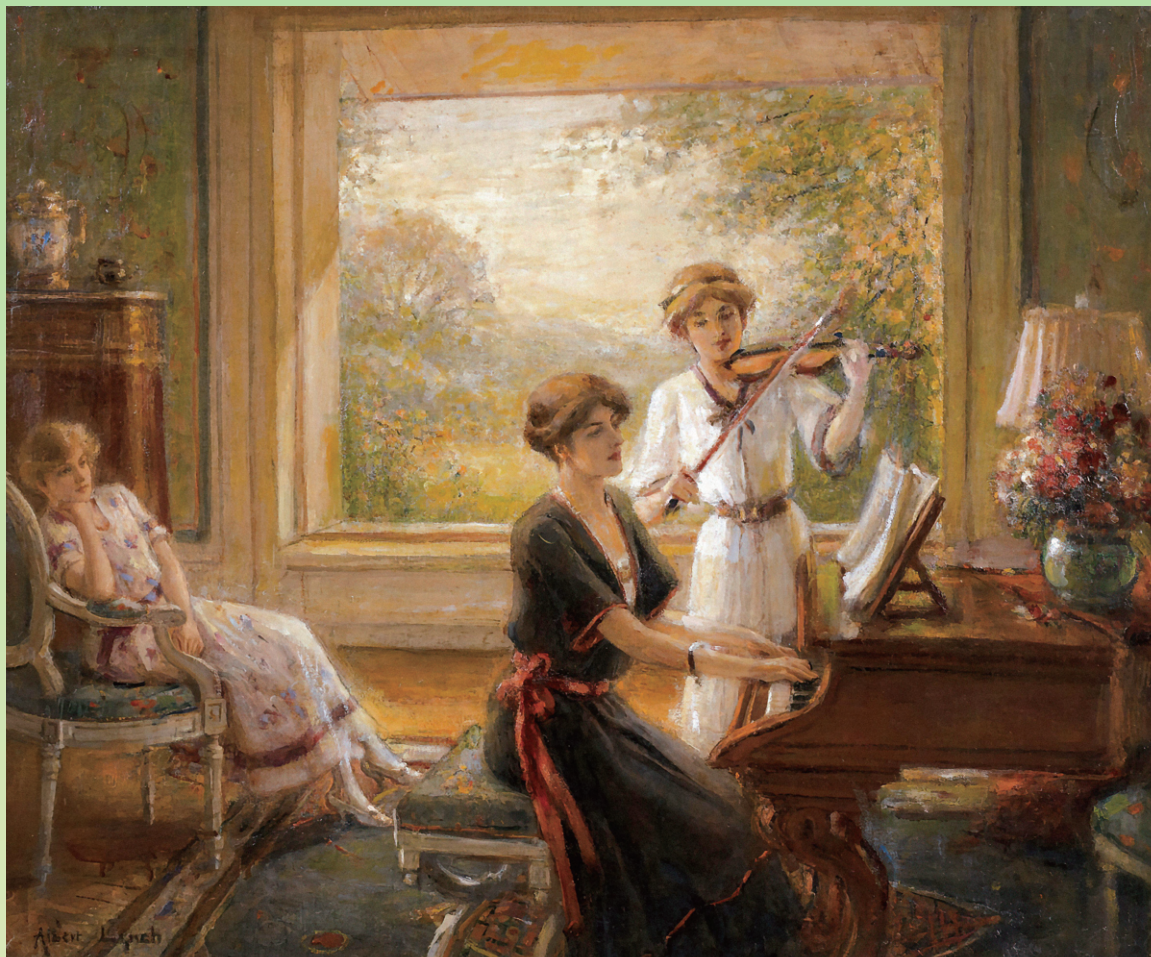
アルバート・リンチ The New Sheet Music by Albert Lynch(1851-1912)