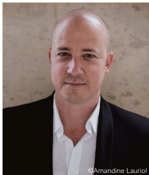
ジュリアン・ジェルネ(ピアノ)