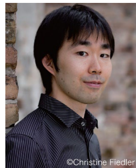
©Christine Fiedler ピアノ: 津田裕也 ロームミュージックファンデーション 2008~2010、2012年度奨学生