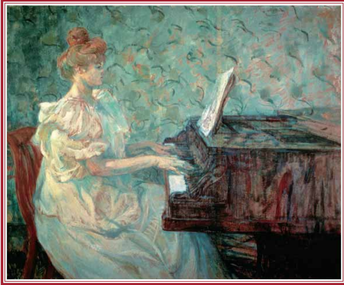
トゥールーズ=ロートレック「グランドピアノを弾く Misia Nathanson」1897年 Toulouse-Lautrec "Misia Nathanson at the grand piano" 1897