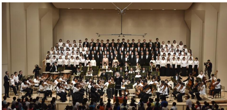
<サイトウ・キネン・フェスティバル松本(2014年)でのベートーヴェン:交響曲第9番演奏の様子>

ローム株式会社(本社:京都市)と、ロームが支援する公益財団法人 ローム ミュージック ファンデーション(京都市)は、音楽文化活動の一環として、“小澤征爾音楽塾 京都・二条城 特別演奏会”を支援します。