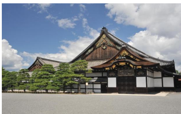
<元離宮二条城・二の丸御殿前>