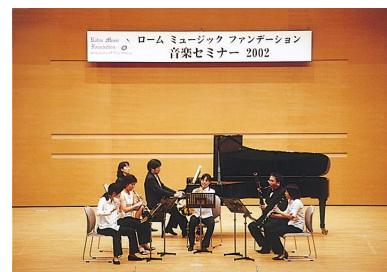
過去の音楽セミナー(管楽器クラス)より

日 時 : 2015年7月26日(日) 14:00開演(13:30開場) 会 場 : 京都府立府民ホール アルティ 出 演 者 : セミナー受講生および講師 曲 目 : 当日発表(受講生によるソロ・アンサンブル及び講師によるアンサンブル) 入 場 料 : 1,000円(消費税込/全席自由) 取 扱 い : チケットぴあ、ローソン・チケット、アルティ、エラート音楽事務所