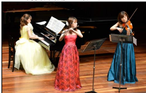
独奏、室内楽の公演 「第34回アンサンブルのタベ」(関西音楽大学協会)