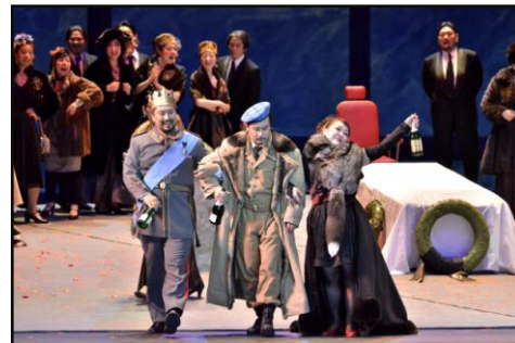
オーケストラ、オペラの公演 「東京二期会オペラ劇場『マクベス』」(東京二期会)

半導体メーカーのローム株式会社(本社:京都市)が支援する公益財団法人 ローム ミュージック ファンデーション(京都市)は音楽文化の普及と発展のため、継続的に実施している「音楽活動への助成と奨学援助」の2014年度分の募集を開始しました。