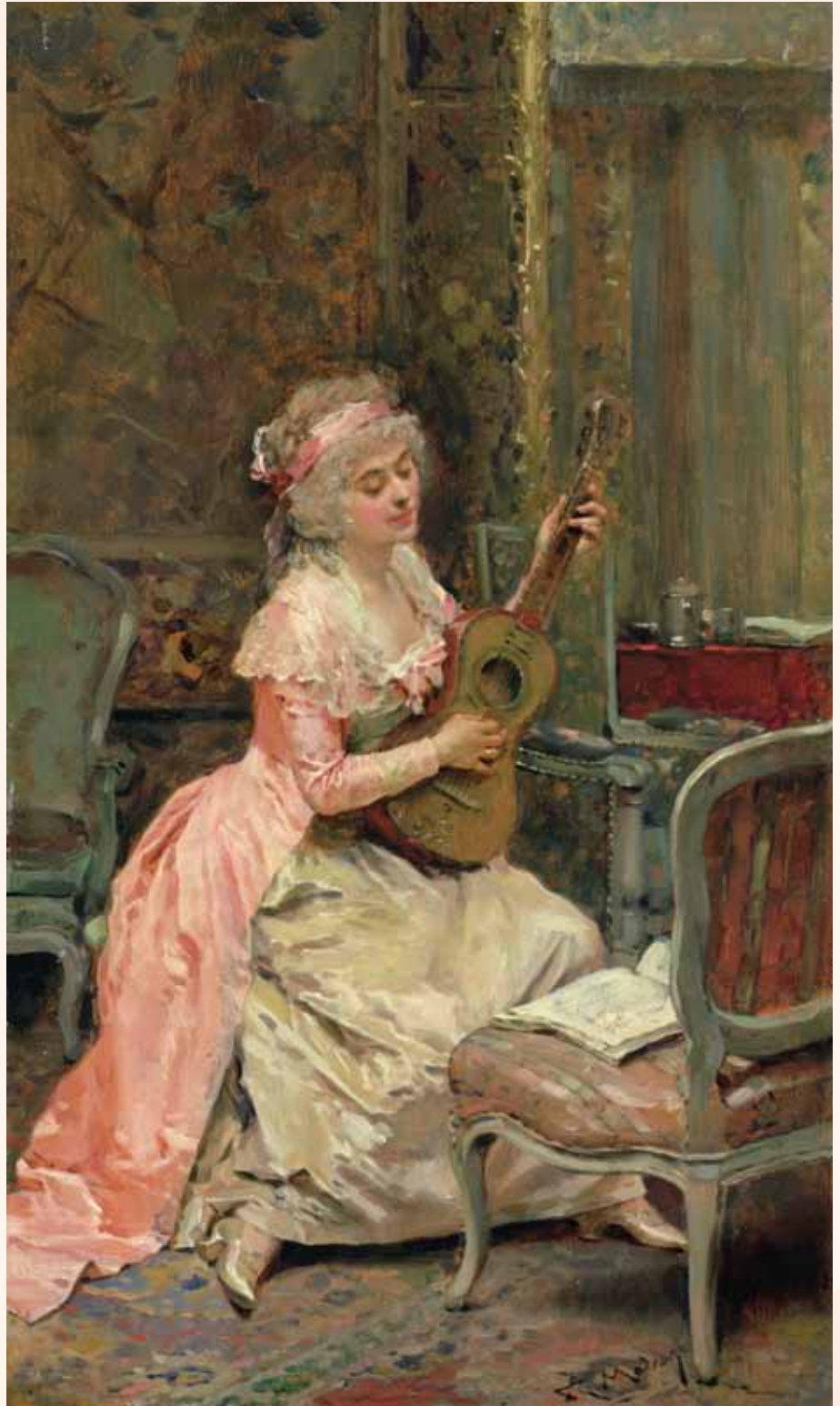
ライムンド・ア・マドラーソ「ギターを弾く女性」(19～20世紀初頭) Raimundo de Madrazo y Garreta "Lady with a Guitar (19th and early 20th century)"