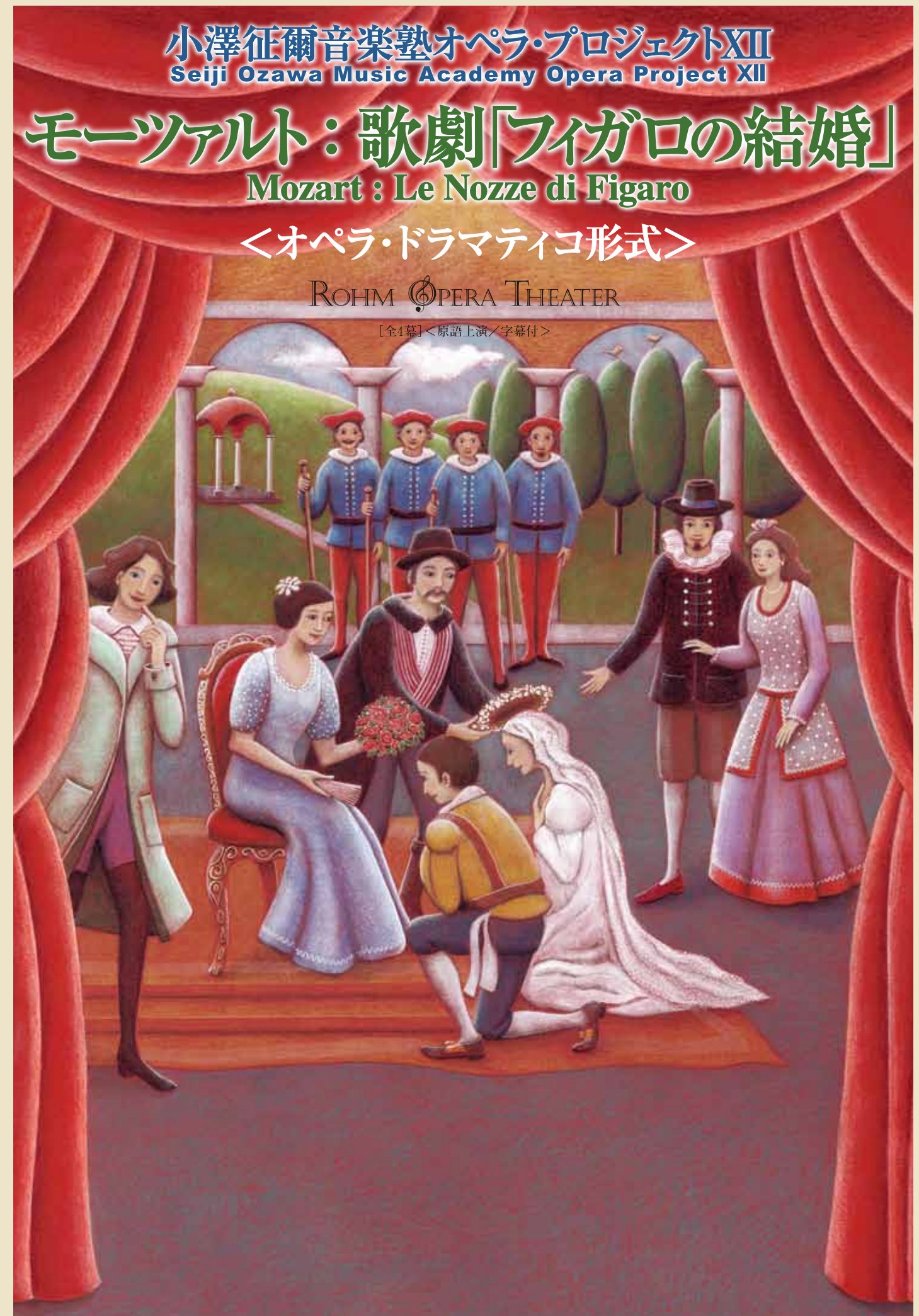
Drawing by Maria Battaglia