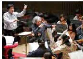
小澤征爾音楽塾オーケストラ・プロジェクトⅡ（2013年3月）での塾長小澤征爾氏の指導風景

半導体メーカーのローム株式会社(本社:京都市)と、ロームが支援する公益財団法人 ローム ミュージック ファンデーション(京都市)は、音楽文化活動の一環として2014年3月16日～26日にかけて行われる“小澤征爾音楽塾オペラ・プロジェクトⅡ モーツァルト：歌劇「フィガロの結婚」<オペラ・ドラマテコ形式>”を支援します。